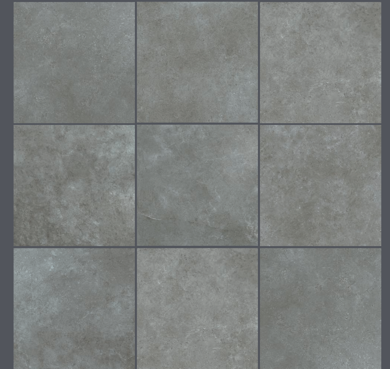
60X60 CM RC ANTHRACITE

DESARROLLO GRÁFICO GRAPHIC DEVELOPMENT · DÉVELOPPEMENT DU DESIGN