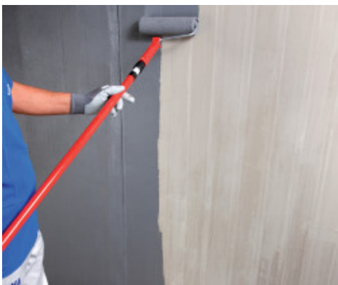
Εφαρμογή Eco Prim Grip Plus με ρολό σε υπόστρωμα από σκυρόδεμα

Σε περίπτωση που χρησιμοποιείται ως βελτιωτικό πρόσφυσης για τσιμενοκονιάματα εξομάλυνσης σε υποστρώματα που έχουν προετοιμαστεί με εποξειδικά ή πολυουρεθανικά αστάρια (όπως Primer MF , Primer MF EC Plus , Eco Prim PU 1K , Eco Prim PU 1K Turbo ) στα οποία δεν έχει γίνει επίταση με πυριτική άμμο, το Eco Prim Grip Plus πρέπει να εφαρμόζεται μετά το πλήρες στέγνωμα και όχι μετά τις 24 ώρες από την εφαρμογή αυτών των ασταριών. Η εφαρμογή αυτού του τύπου επιτρέπεται σε περίπτωση εξομαλύνσεων με πάχος όχι μεγαλύτερο από 10 mm και αν δεν προβλέπεται η τοποθέτηση μασίφ φυσικού ξύλου.