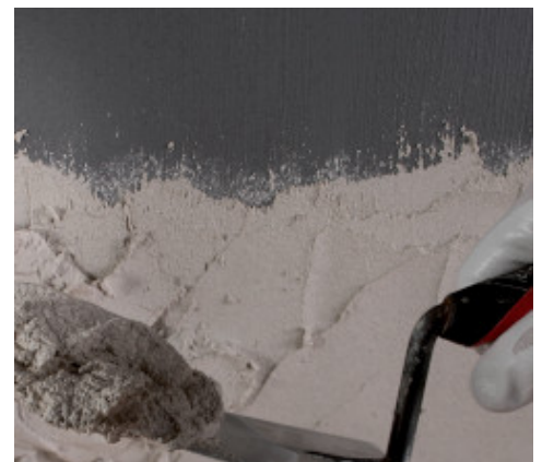
Εφαρμογή σοβά σε Eco Prim Grip Plus