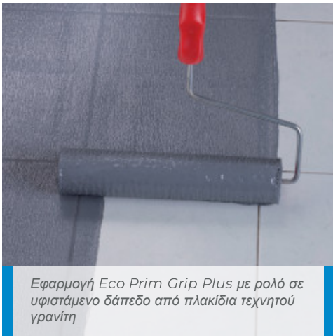
Εφαρμογή Eco Prim Grip Plus με ρολό σε υφιστάμενο δάπεδο από πλακίδια τεχνητού γρανίτη