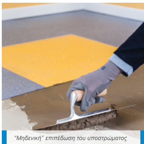
“Μηδενική” επιπέδωση του υποστρώματος