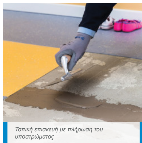
Τοπική επισκευή με πλήρωση του υποστρώματος