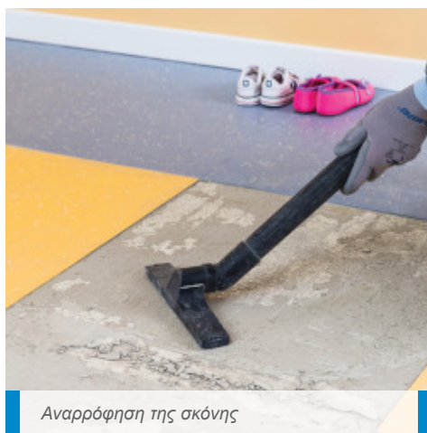
Αναρρόφηση της σκόνης